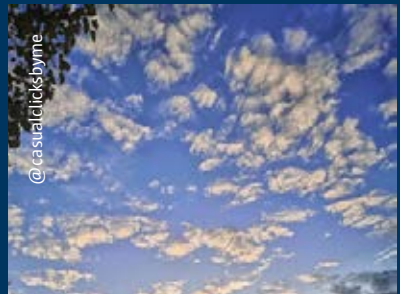
Dankzij Noor kunnen wij ook genieten van deze indrukwekkende wolkenhemel boven de Lambrechtshoekenlaan. @casualclicksbyme