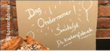
Op Dag van de Ondernemer op 22 november 2019 versterkte De Koekenfabriek de ondernemende geest met koffiekoeken. @koekenfabriek