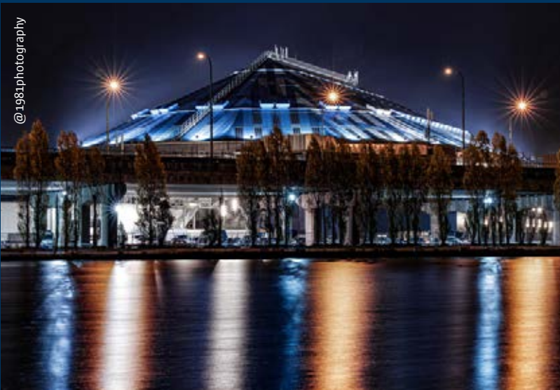
Donique legde een prachtige reflectie vast op de gevoelige plaat