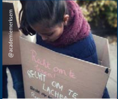
Academie Merksem kreeg op 20 november als de eerste academie in België het label 'Kinderrechtenacademie' toegekend. @academiemerksem